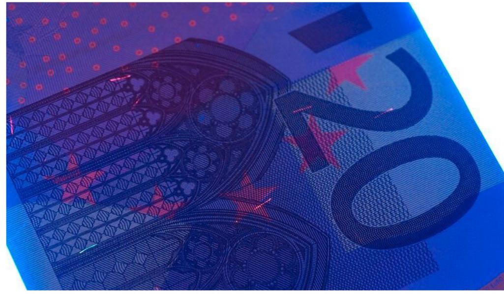
Банкнота от 20 евро, поставена под ултравиолетова светлина